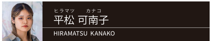
ヒラマツ カナコ 平松 可南子 HIRAMATSU KANAKO

大阪府出身。2022年東京藝術大学大学院美術研究科絵画専攻修了。主な展覧会に2023年「イ反」(三菱一号館美術館歴史資料室/東京)、2024年「TOKAS-Emerging 2024/砂を積む」(トーキョーアーツアンドスペース/東京)など。アリが砂を積む行為や雨のたびにに変化する水たまり、噴射しながら重力で形を保っている噴水など、ものが繰り返しあらわれ、変化してゆく現象をモチーフとして描いている。絵と正対した鑑賞だけでなく、展示という状況を含めた絵画表現を模索している。